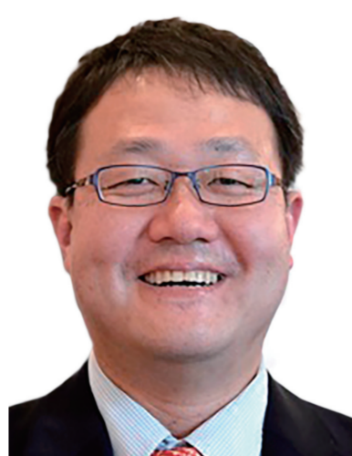
田中 求 京都大学 特任教授、 ハイデルベルク大学 教授